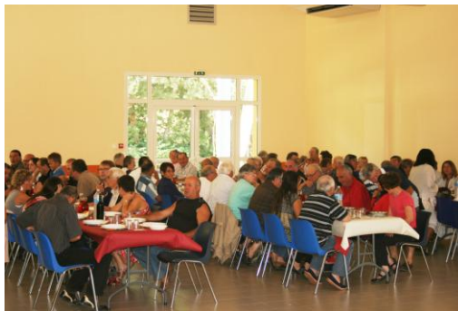
Le Président des chasseurs, le maire de Lignan-de-Bazas et tous les convives des trois communes en 2012