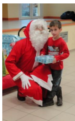
Petits Lignanais de 2012