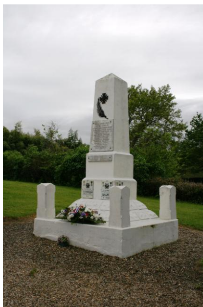
Le monument aux Morts de Lignan-de-Bazas en 2012

Un vin d'honneur dans la salle des fêtes " l'Oustaou de Leinha" a clôturé cette cérémonie.