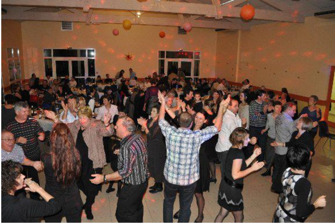
Fêtards de la Saint-Sylvestre 2012

A la Saint-Sylvestre le Comité des fêtes a organisé son réveillon, les convives sont repartis pleins de bonnes résolutions et heureux.