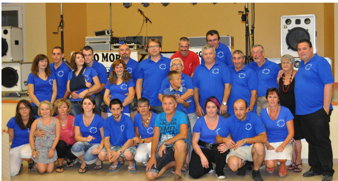
Le Comité des fêtes de Lignan-de-Bazas en 2012

Fidèles à cette manifestation une petite centaine de personnes se sont retrouvées autour d'un repas et ont pu partager de multiples attractions et activités savamment concoctées par le Comité des Fêtes et leur nouveau tee-shirt.