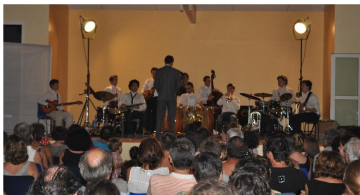
Los Gojats and C° en 2012

PAS DE COUAC..... MAIS UN CANARD SAUVAGE !