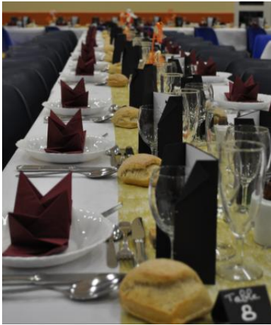
Tables de la reception